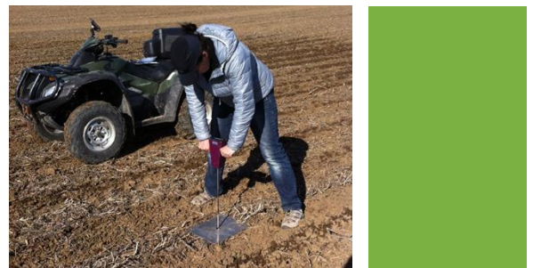
Figure 1. Prise de données avec le pénétromètre numérique-

Un modèle basé sur les données de pénétrométrie ainsi que sur certaines analyses de laboratoire sera généré pour ce type de sol et validé à l'aide de plusieurs échantillons prélevés dans différentes régions du Québec. Ce modèle permettra par la suite d'estimer les profils de compaction des 50 premiers centimètres de profondeur de n'importe quel champ présentant une texture similaire et ce peu importe le moment dans la saison de culture et donc l'état du sol (humide vs sec)